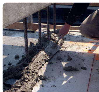
Ondersabelingsmortel - Ondersabelen van staalconstructies