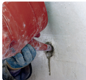
Krimpvrije gietmortel - Opgieten van gaines