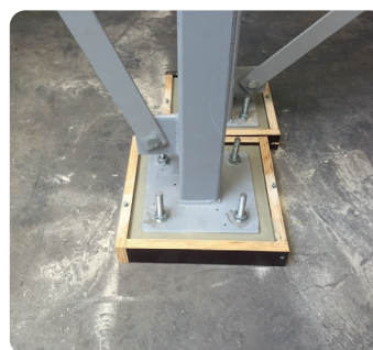
Krimpvrije gietmortel - Ondergieten van staalconstructies en machines